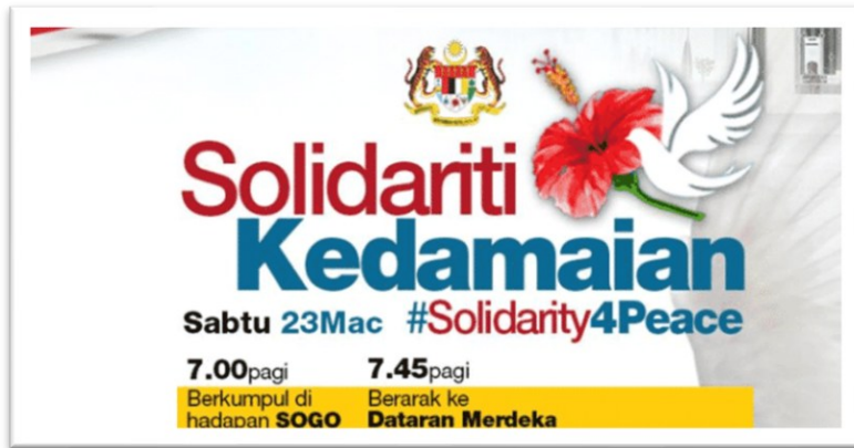
Logo perhimpunan Solidariti Kedamaian

Burung merpati juga sering dilambangkan sebagai penghantar (kurier) dan komunikasi. Hal ini kerana pada zaman dahulu burung merpati sering digunakan sebagai penghantar pesan atau surat, medium untuk berkomunikasi. Berkomunikasi menggunakan burung merpati telah ditubuhkan sekitar abad ke-5 sebelum Masihi. Pada zaman Rom, burung merpati digunakan sebagai pembawa hasil dalam acara sukan Sukan Olimpik. Justeru, merpati sering dibebaskan pada sesi pembukaan Sukan Olimpik.